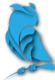
Рисунок 1 - Оформление рисунков и иллюстраций Рисунки только в формате .jpg