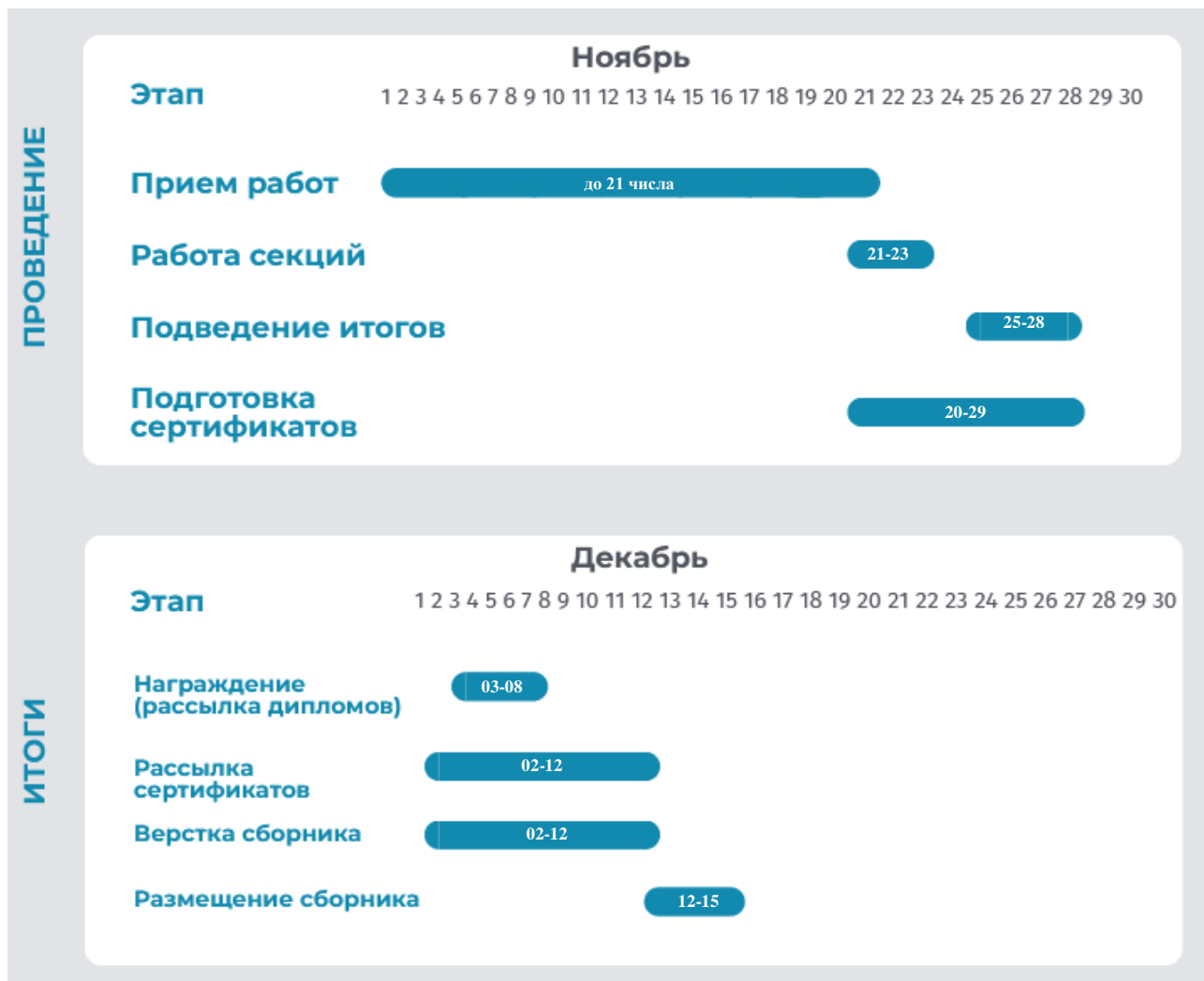
График работы МНПК «ИИТМА-2024»